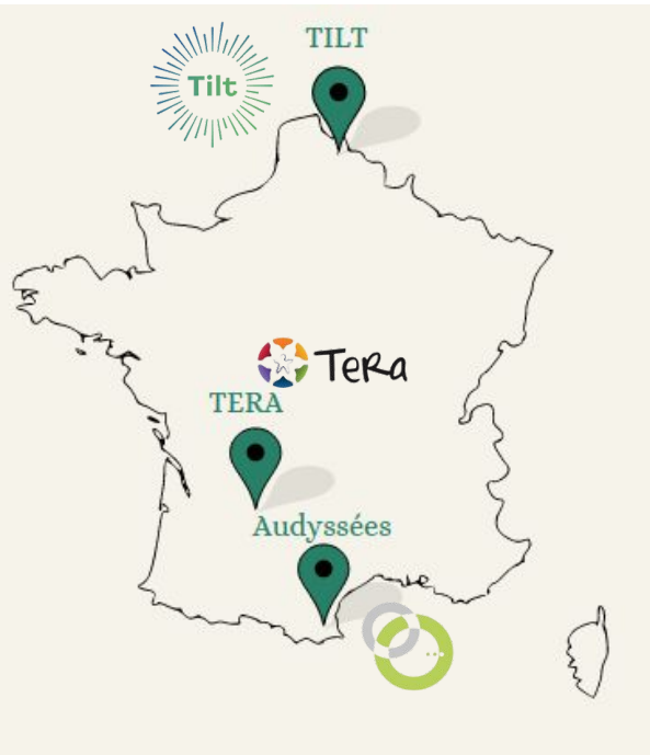
3 territoires pilotes avec des traits communs: territoires fragiles / en déclin

Des modèles différents, une finalité commune => l'émergence de nouveaux modèles économiques et financiers et d' emplois/métiers écologiques et solidaires dans les territoires