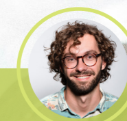
Alimentation et Agroécologie ...