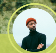
Low-tech et recyclage ...